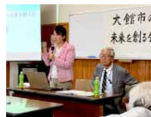
7月には「幸せな老後」をテーマに、セミナーも開催

そこで、私は小さな試みをすることにしました。私が生まれ育った比内町扇田の長岡城跡のエリアを多世代が交流できる地域共生社会の拠点、「比内ヒルズ」として、そこで様々な活動をスタートすることにしました。裏面に詳細を記載いたしました。ご覧いただければ幸いです。